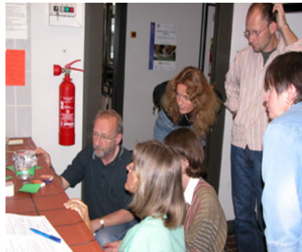
Weitere LehrerInnen- Professionalisierung